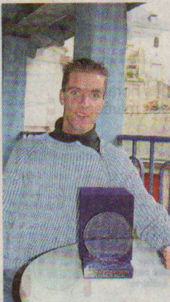
Hier à Quimper, avec son « César » du cirque, « la piste de cristal ».

En France, il y a deux festivals internationaux du cirque : Monte-Carlo et Massy. Le Quimpérois vient de remporter le 1 er prix de ce dernier.